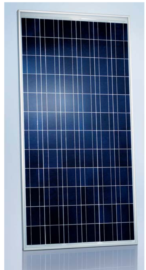
SCHOTT POLY™ 165/170/175/180