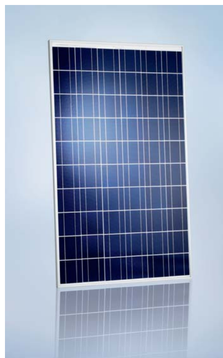
SCHOTT POLY™ 217/220/225/230